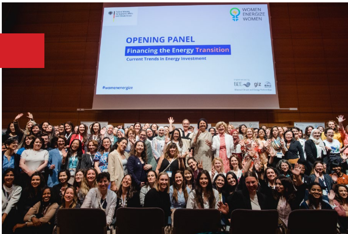
Delegación Uruguaya, del Proyecto Fortaleciendo la Transición Energética (ForTE), presente en la feria The Smarter E Europe, Alemania.